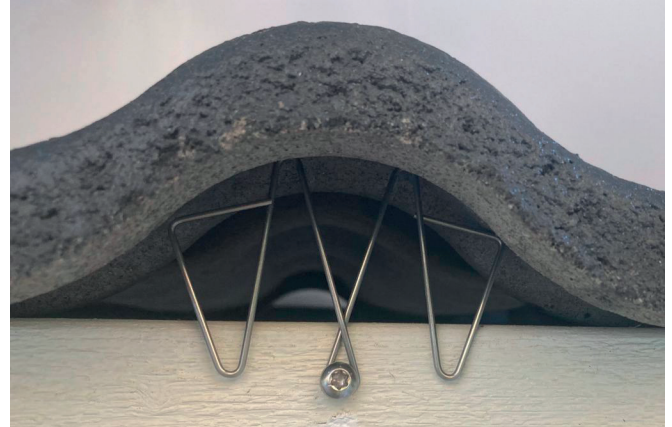
No Birds -oravaeste asennettuna