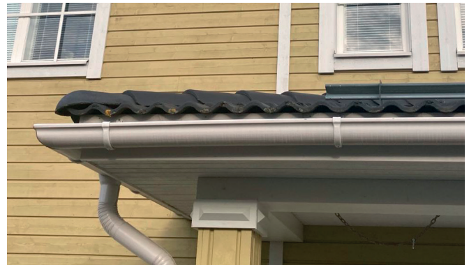
No Birds -oravaeste soveltuu moniin vesikatteisiin

No Birds -oravaeste kiinnitetään otsalautaan RST-ruuveilla tai muulla alustaan soveltuvalla tartuntamenetelmällä. No Birds -oravaeste on erittäin pitkäikäinen ja siksi on tärkeä varmistaa, että kiinnikkeen materiaali vastaa oravaesteen käyttöikää ja ominaisuuksia. No Birds -oravaeste soveltuu moniin vesikatteisiin ja se on helppo jälkiasentaa myös vanhempiin kattoihin.